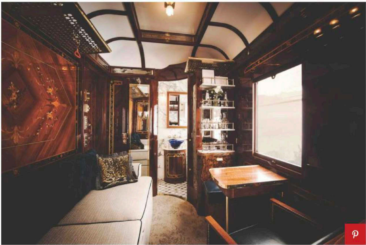
Venice Simplon Orient Express

Mezzo di trasporto prediletto dal jet set internazionale, in particolare nei primi del Novecento, il treno onora la sua aura leggendaria ma la rinverdisce con nuovi itinerari e allestimenti . Scoprire l'Europa nascosta, sulle orme dei mitici Grand Tour di una volta: è questo l'intento dei viaggi proposti a partire da quest'estate, che attraversano l'Italia, la Svizzera, il Belgio e i Paesi Bassi, in aggiunta alle tappe immancabili di Parigi e Londra.