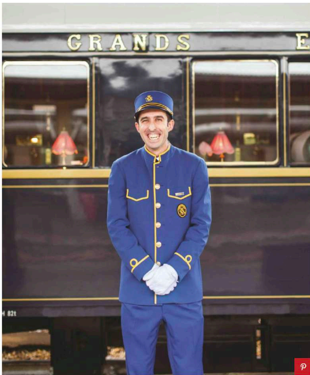
Venice Simplon Orient Express

Formato da 17 vagoni letto originali del 1920 e 1930, il treno vanta sei Grand Suite, sistemazioni esclusive dove la magia del passato coesiste con il massimo del comfort e del servizio , di cui tre nuove di zecca, ribattezzate con i nomi di altrettante storiche tappe del suo percorso: Vienna, Praga e Budapest. Il design di ciascuna suite è un tributo a queste città, intriso di romanticismo, spirito d'avventura e sfarzosa eleganza.