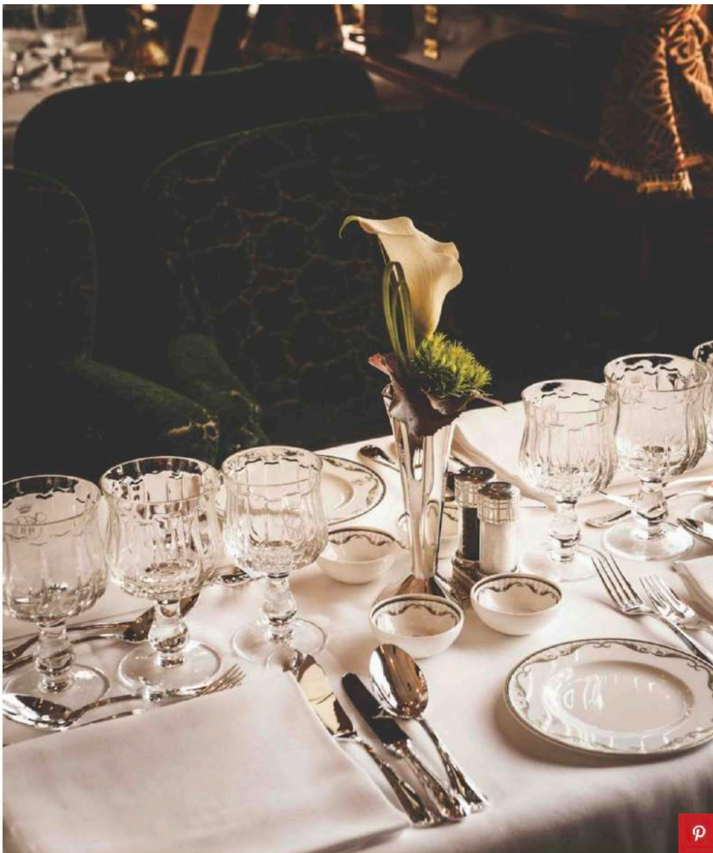
Venice Simplon Orient Express

A questo si aggiunge la raffinata proposta culinaria del ristorante di bordo , che promette di soddisfare tutti i gusti, con materie prime di alta qualità recuperate sempre fresche lungo il cammino, dall'aragosta della Bretagna all'agnello di Mont St Michel. E se non bastasse, per le partenze italiane gli ospiti possono abbinare al viaggio un soggiorno presso una delle proprietà Belmond più prestigiose: come il Cipriani Hotel di Venezia o Villa San Michele a Firenze.