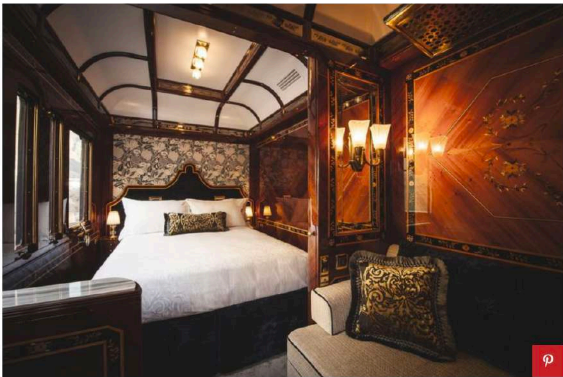
Venice Simplon Orient Express

La perizia artigianale e la cura dei dettagli raccontano un'idea antica di lusso, che passa attraverso magnifici mosaici, cuscini ricamati a mano e intarsi scolpiti con minuziosa maestria. Materiali preziosi e arredi di pregio fanno da sfondo ad ambienti ampi, che fanno dimenticare di trovarsi sui binari: ogni suite si compone infatti di camera da letto, bagno e salotto privato, un microcosmo sospeso nel tempo e nello spazio, da cui farsi avvolgere completamente.