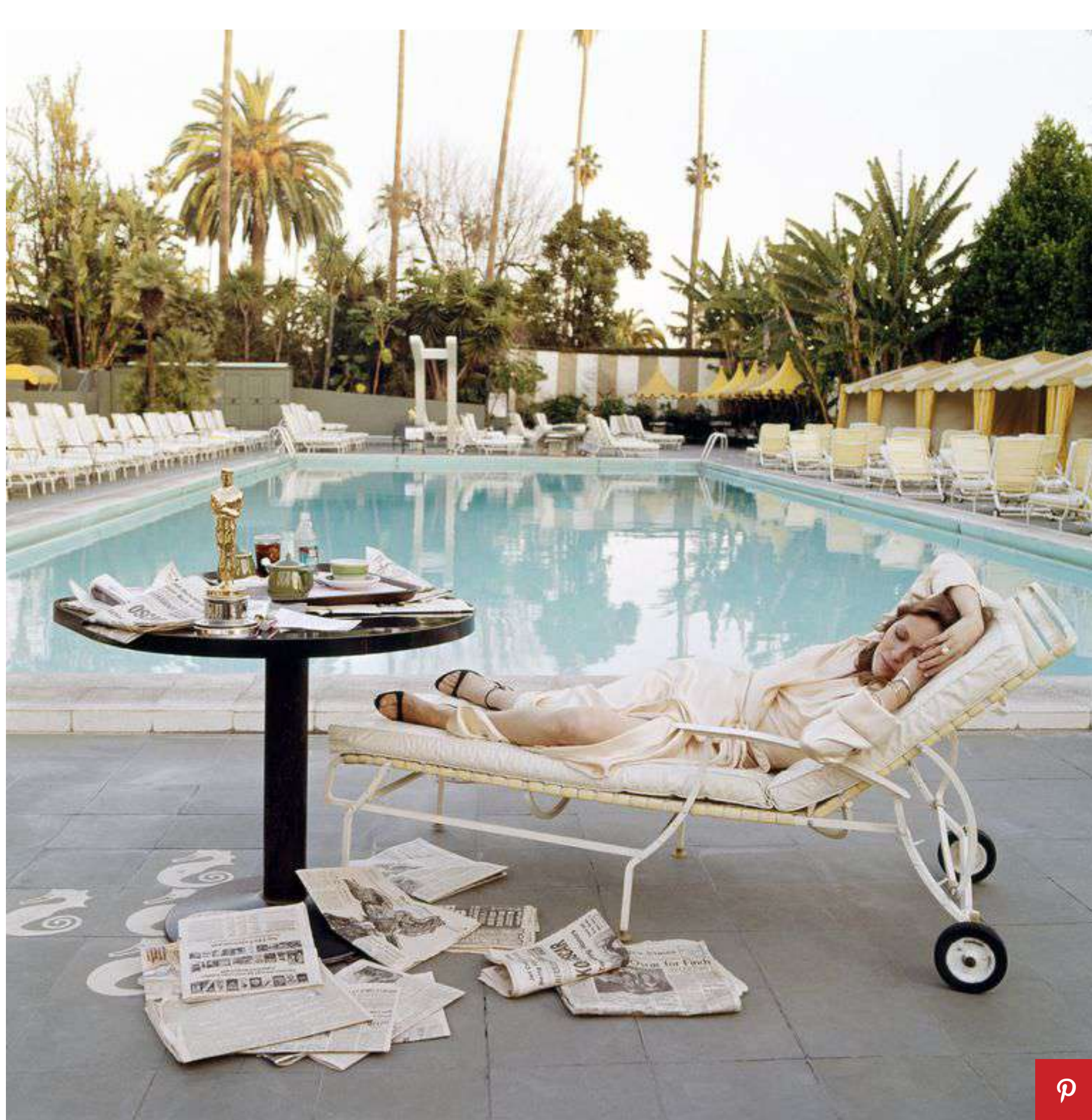
Faye Dunaway, 1977, dalla mostra From Venice with Love

Le occasioni per un soggiorno al Cipriani sono ancora tante, perché in occasione dei 1600 anni di Venezia sono in programma eventi e itinerari irrinunciabili. Qualche esempio? Si va alla scoperta degli archivi segreti della città e si entra in edifici strepitosi quali la biblioteca di San Vidal, quella di San Francesco della Vigna o della Fondazione Cini. Mentre l'accesso esclusivo a Palazzo Mocenigo , Ridotto Venier e in una dimora privata è l'opportunità imperdibile per scivolare nei fasti della moda veneziana, tra abiti, gioielli e accessori. Dal 11 al 14 novembre, invece, si prospetta un fine settimana all'insegna delle antiche arti kintsugi e della ceramica iznik . Laboratori e incontri con maestri e ceramisti sono l'occasione per regalarsi una vacanza a tutto tondo per celebrare l' art de vivre .