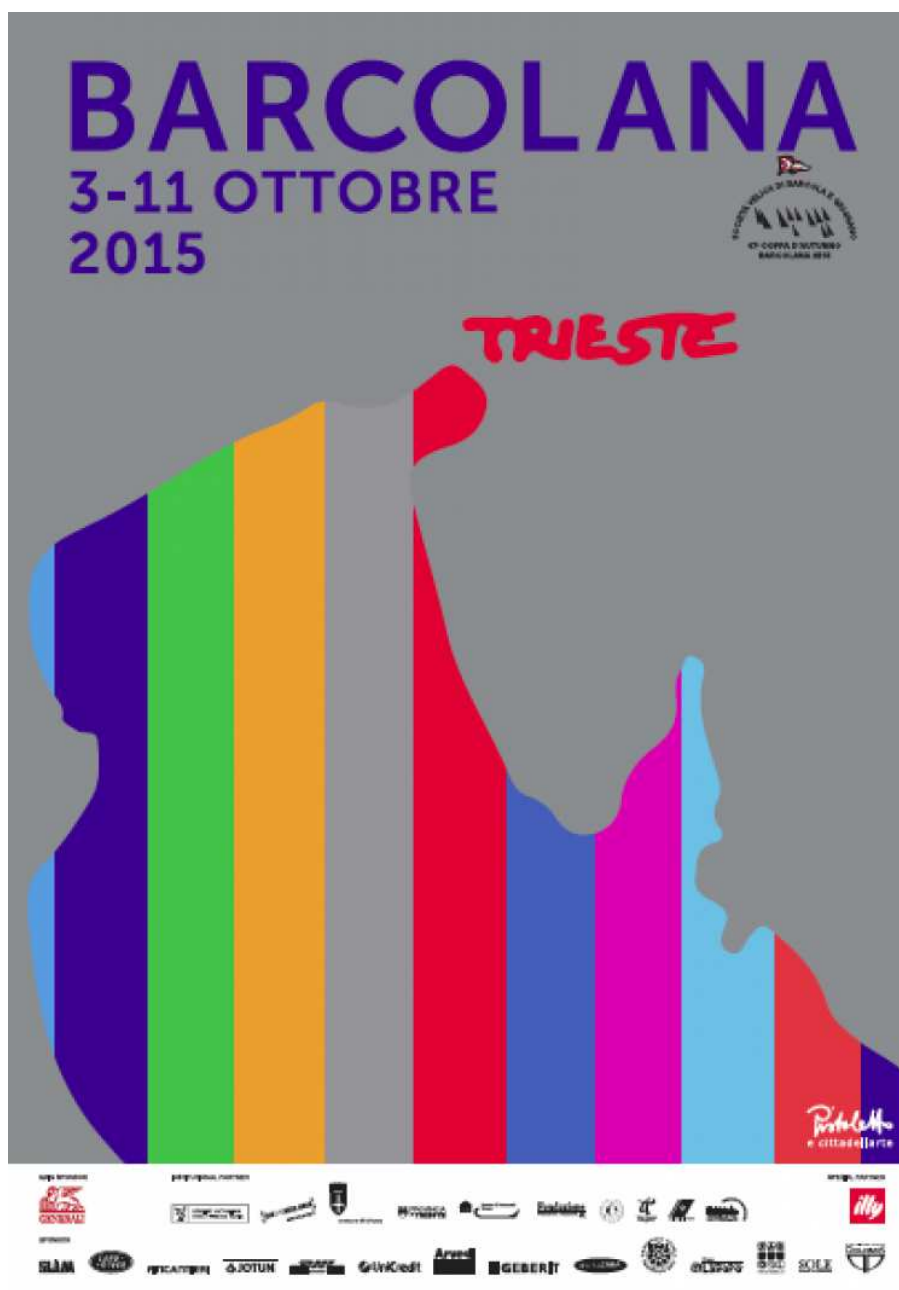
Manifesto 47a Barcolana 2015 by Michelangelo Pistoletto